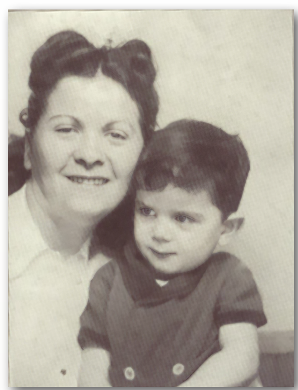
Jean Bender.